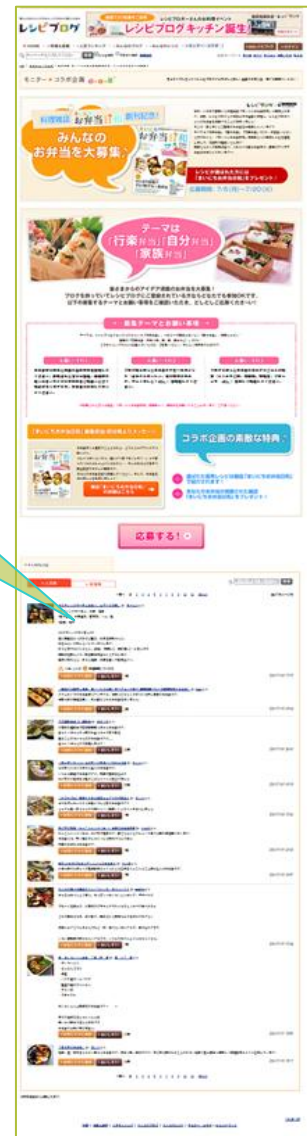
レシピブログでの募集実施画面